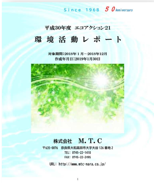
平成30年度EA21 環境活動レポート

現在、北極の水は解け、砂漠は拡大しています。それによる海面上昇、それに最近よく耳にする異常気象も大きく環境破壊に関係しているといわれています。